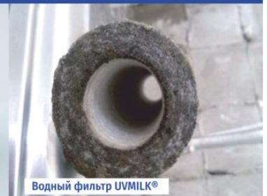
Водный фильтр UVMILK®