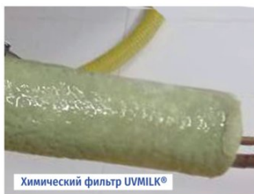
Химический фильтр UVMILK®