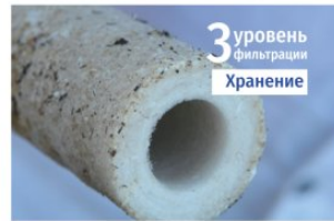
3 уровень фильтрации Хранение