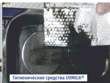
Гигиенические средства UVMILK®

Используя гигиенические полотенца, салфетки и фильтры UVMILK® для моющих средств, вы обеспечите эффективную очистку щелочных и кислотных сред в производстве и хозяйстве за счет удаления всех нерастворившихся частиц; а также обеспечите уход за молочным оборудованием, спецтехникой и бытовыми помещениями за счет материалов, задерживающих органические и неорганические загрязнения.