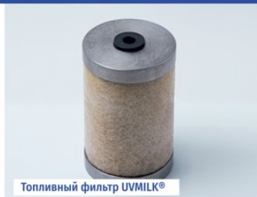
Топливный фильтр UVMILK®

Используя водные и топливные фильтры UVMILK®, вы получите чистую воду для промывки оборудования и для хозяйственно-бытовых целей за счет эффективной очистки воды от механических загрязнений и хлоридов; а также сократите расход топлива, издержки на ремонт и амортизацию молоковозов и оборудования котельной за счет очистки топлива от ржавчины, парафина, пыли и шлама.